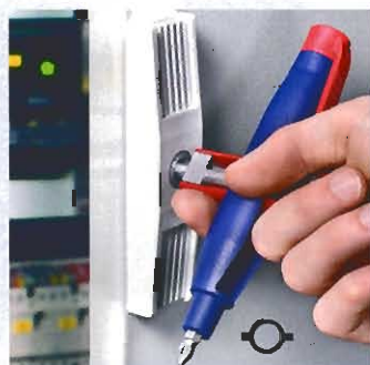
Öffnen eines Schaltschrankes mit Doppelbart (Bestell-Nr. 00 11 07)