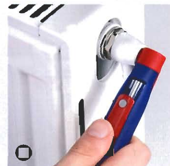
Vierkant zur Heizungsentlüftung (Bestell-Nr. 00 11 07 + 00 11 08)