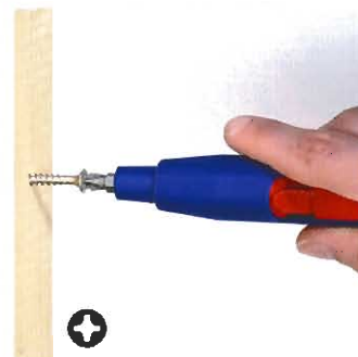
Anziehen einer Schraube mit Kreuzschlitz-Bit PH2 (Bestell-Nr. 00 11 07 + 00 11 08)